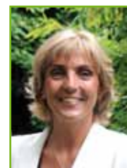
Valérie Létard, secrétaire d'État auprès de Jean-Louis Borloo, ministre d'État

Madame, Monsieur le Maire, c'est ensemble que nous pourrons peu à peu réussir le grand chantier de l'accessibilité.